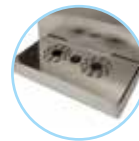
B1. Bandeja básica