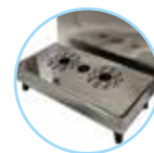
B2. Bandeja con desagüe