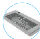
B1. Bandeja básica

Dispensador de sobremesa. Acero-ABS. Con frontal de cristal.