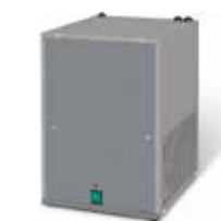
Caldera de agua caliente

Sistema dispensador de agua caliente para el mercado de Horeca y doméstico. Para taladrar en barra.