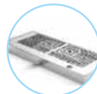
B2. Bandeja con desagüe