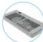
B1. Bandeja básica

Adaptador H3/4" - Espiga 8 mm. Codo unión 8 mm. Adaptador M3/8" - 8 mm. 2 m tubo 8 mm. *Reductor presión CO 2 .